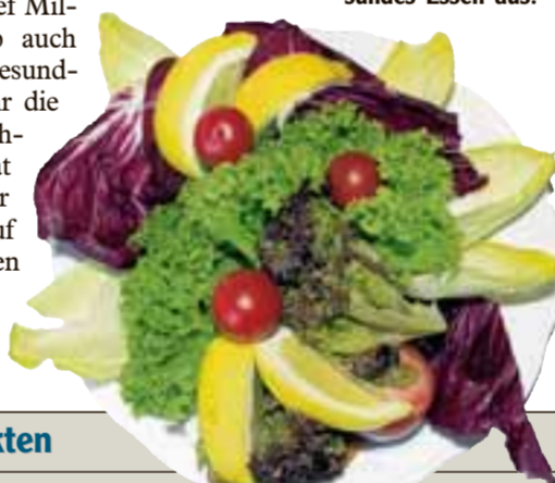
So lecker sieht gesundes Essen aus.

● Fettleibigkeit und ihre Folgeerkrankungen gehören laut Weltgesundheitsorganisation in den Industrienationen zu den häufigsten Todesursachen.