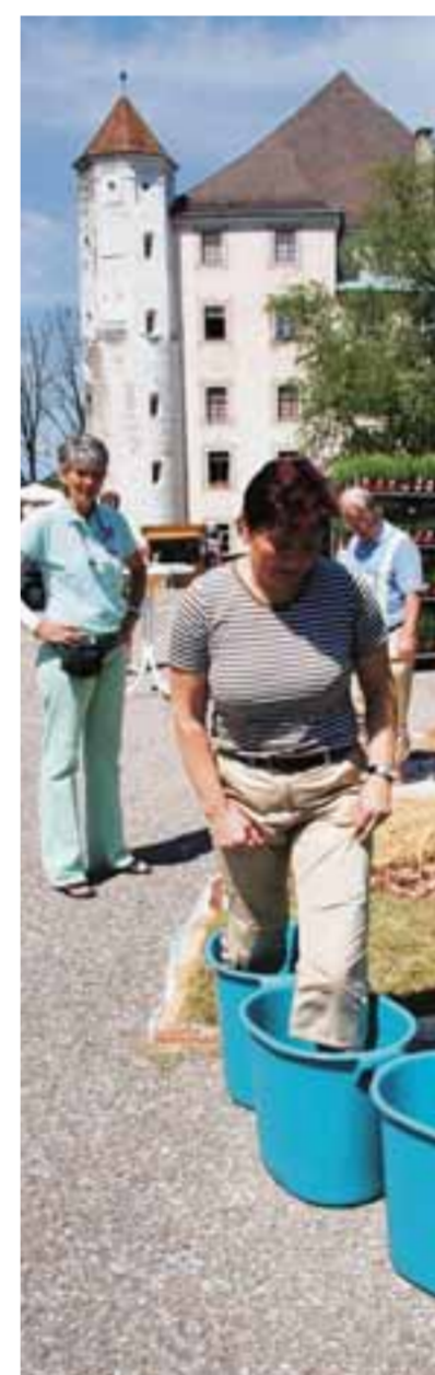
Am Wochenende drehte sich im Hohen Schloss in Bad Grönenbach (im Hintergrund) alles um die Gesundheit. Rund 1300 Besucher kamen zu Gesundheitsmesse und Regionalmarkt.