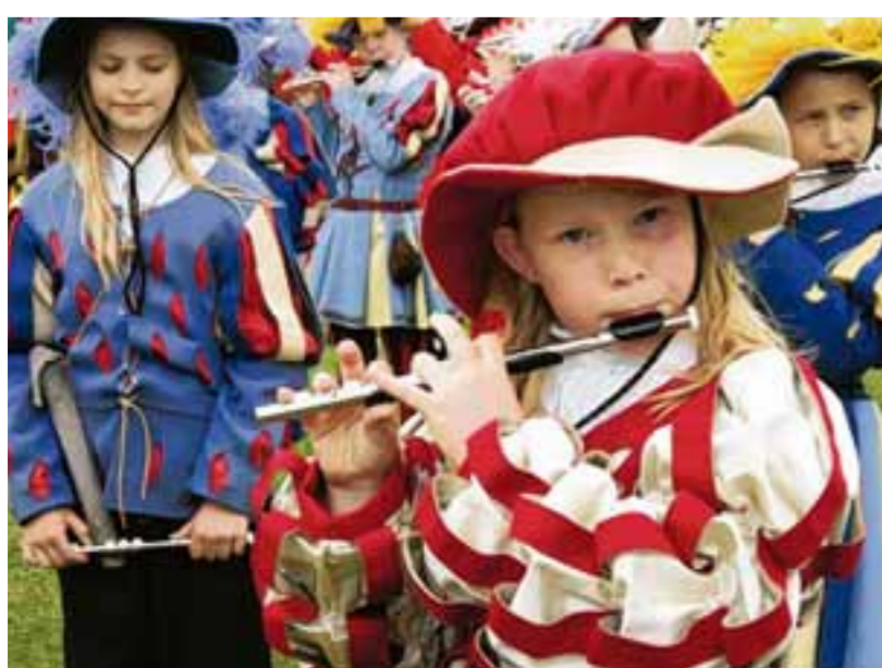
Bunt und fröhlich wird es auch in diesem Jahr wieder beim Helfensteiner-Tag im Eicht zugehen. Hoffentlich spielt am Donnerstag auch das Wetter mit.

Telefon: 08261/991310 in Bad Wörishofen: Telefon: 08247/350310 E-Mail: anzeigen@mzonline.de Abo-Service/Zustellung: Telefon: 08261/991330 in Bad Wörishofen: 08247/350330